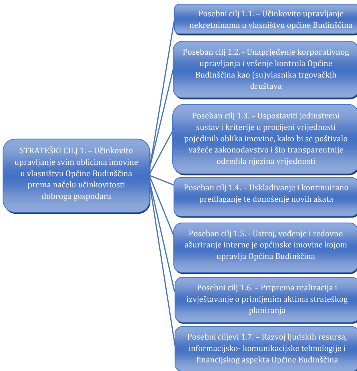
Slika 2. Kaskadiranje strateškog cilja upravljanja općinskom imovinom